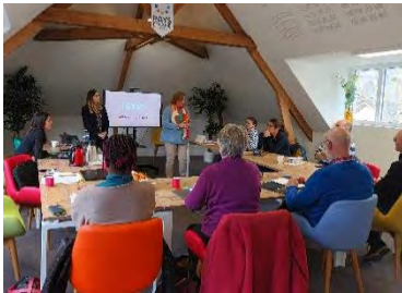
Atelier Facebook avec l'agence de communication SO'comm