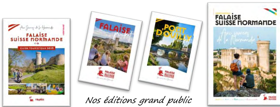
Nos éditions grand public

Accueil et conseil en français et langues étrangères, collecte et diffusion des informations touristiques, observation et analyse de l'activité touristique, animation des réseaux sociaux, de la borne 7/7 et des écrans d'information.