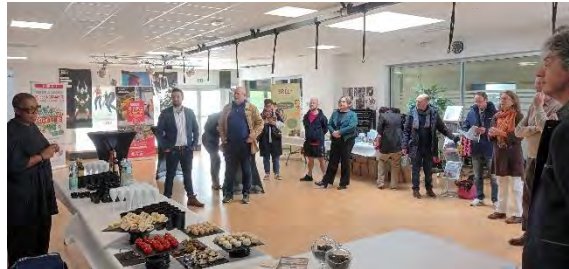
Journée rencontre des partenaires de l'Office de Tourisme Mars 2023 – Centre aquatique Forméo