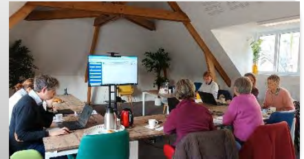
Atelier Tourinsoft avec Calvados Attractivité

Profitez de temps d'échanges, d'ateliers, d'informations spécifiques et d'avantages toute l'année en rejoignant notre communauté touristique.