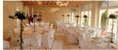
AU DOMAINE DE LA TOUR 130 personnes assises

Pour vos réceptions, vos événements familiaux, vos séminaires... profitez de notre offre complète de salles parfaitement adaptées et équipées.