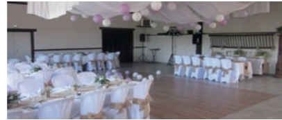
LE RELAIS DES LONGS CHAMPS 120 personnes assises

Tombez amoureux de la Normandie dans une magnifique propriété du XVIII e siècle, au sein d'un grand domaine naturel, à 3 minutes de la ville de Falaise. Situé à proximité des lieux touristiques, de grandes salles de caractère accueillent vos réceptions, mariages ou séminaires.